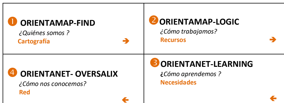
Ilustración 1. Fases de desarrollo de la acción de orientación

Todos los socios implicados en la acción participan del siguiente modo: